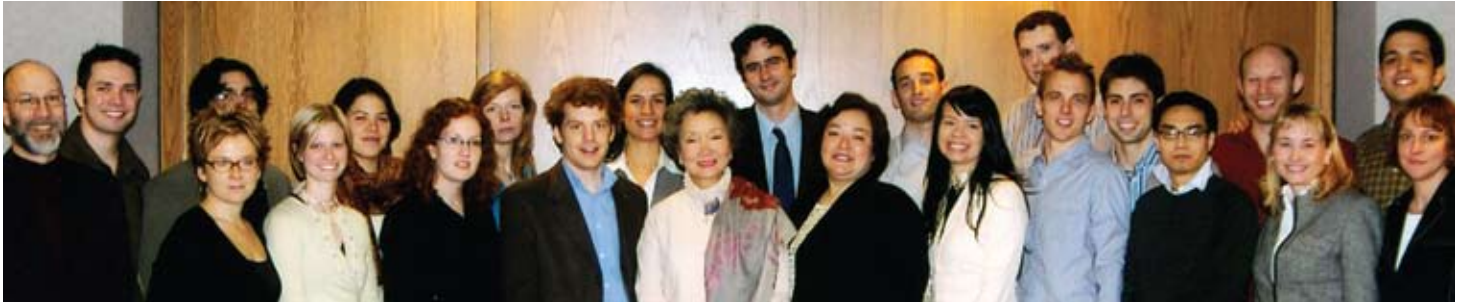
La très honorable Adrienne Clarkson (au centre), alors gouverneure générale, a fait part aux boursiers 2004 de sa vaste expérience en tant que leader canadienne, lors d'une table ronde qui a eu lieu pendant la réunion de travail d'Ottawa.

« La remarquable diversité des boursiers m'est apparue plus clairement lors de nos séances de travail en groupe. Dans mon équipe de cinq membres figuraient un ancien employé du Bureau du Conseil privé, un commandant des Forces armées canadiennes, un leader autochtone, le directeur d'un groupe de réflexion sur l'environnement et un défenseur des droits des enfants. »