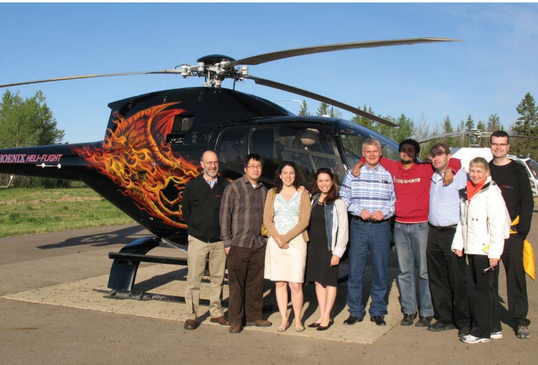
Lors de leur visite à Fort McMurray, en juin 2007, les boursiers ont pu observer les sables bitumineux depuis le ciel et prendre la mesure des problèmes stratégiques et des possibilités qui se présentent à la grande industrie primaire.