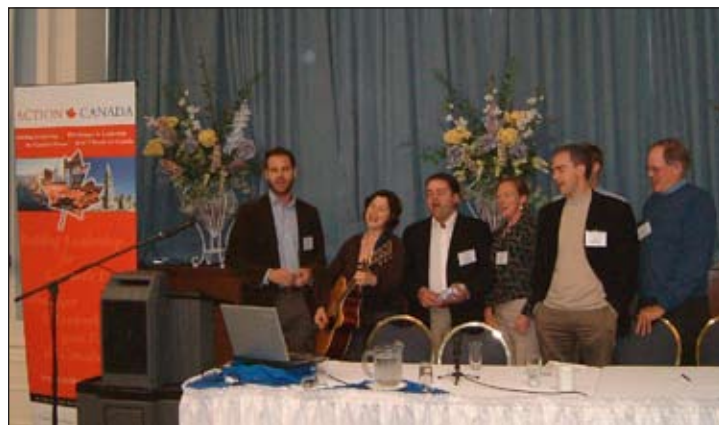
La célèbre chanson folk de Stan Rogers, Northwest Passage, était l'ouverture parfaite pour la présentation du projet du groupe Icebreakers.

Le groupe a bon espoir que des organismes comme International Polar Year, Arctic Youth Network et le programme Nunavut Sivuniksavut à Ottawa se serviront du dialogue pour favoriser les discussions sur les enjeux polaires. Le groupe a rendu compte des résultats du sommet dialogue aux décideurs, aux universitaires et aux médias et préparera un outil éducatif pour faciliter la discussion sur des enjeux qui préoccupent les Canadiens du Nord.