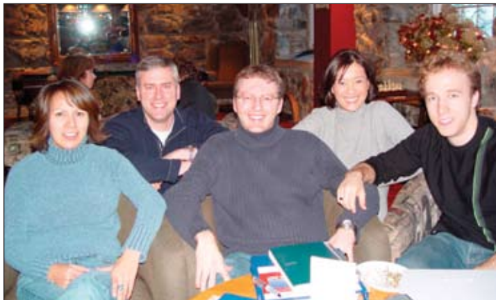
Le groupe de projet Seeking Common Ground à la réunion de travail d'Ottawa

Le groupe a ensuite rédigé un rapport présentant des principes constructifs et des recommandations. Ce rapport pourrait être publié par l'Université Simon Fraser dans sa série Dialogue. Les résultats du forum seront largement diffusés. Ils seront également disponibles sur le site www.seekingcommonground.ca . Le groupe a également créé un listserver pour permettre aux participants au dialogue de continuer à mettre en commun expertise et ressources.