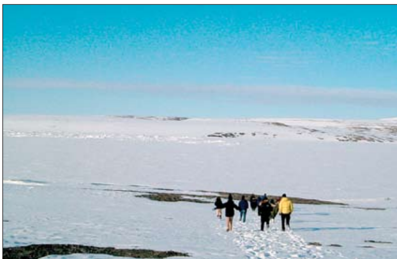
Les boursiers courent vers l'océan Arctique sous le soleil de minuit

« Il serait insuffisant de dire que l'année de bourses a totalement changé ma perspective sur le Canada. A la suite du séjour au Nunavut, j'ai l'impression d'avoir une vision plus large sur l'échelle du pays ainsi que les défis que rencontrent ses communautés indigènes. » Boursier d'Action Canada