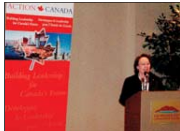
Sheila Watt-Cloutier, présidente de la Conférence circumpolaire inuit, parlant en Iqaluit